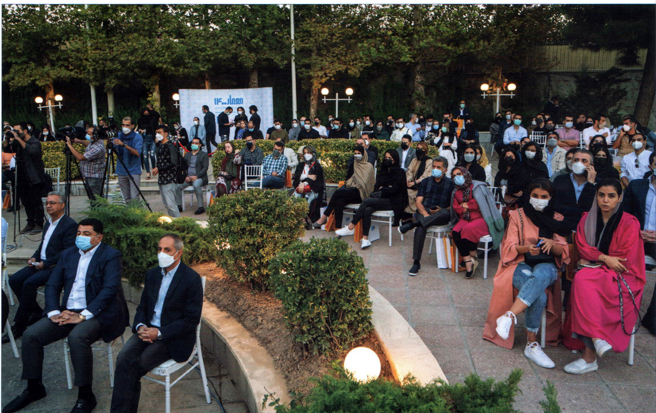
Memar Award ceremony, 2021